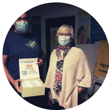
Donation au coordinateur Téléthon