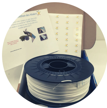
Filament pour imprimante 3D

Évite au masque de tomber - Réutilisable - Tous types de masque - Diminue la formation de buée - Pince-masque en PLA biosourcé à base d'amidon de maïs